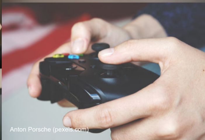
Anton Porsche (pexels.com)