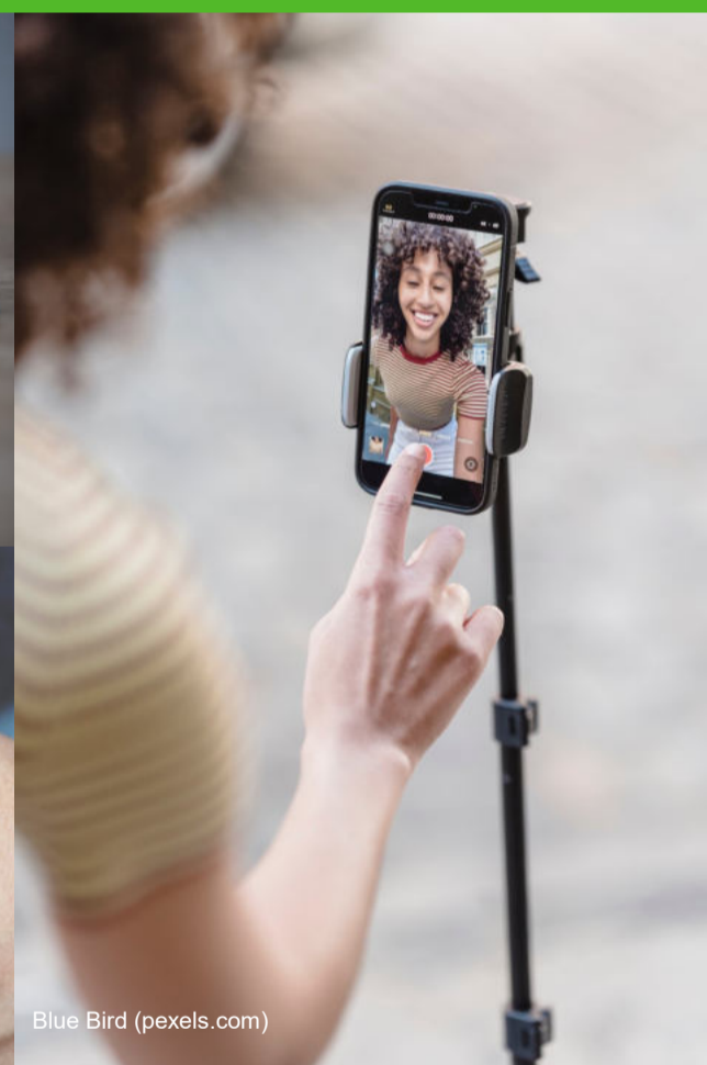
Blue Bird (pexels.com)

Unverbindliche Informationsveranstaltungen